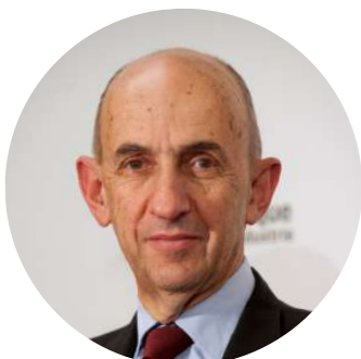
LOUIS GALLOIS Parrain de l'édition 2023