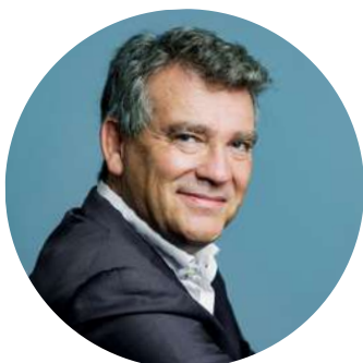
ARNAUD MONTEBOURG Parrain de l'édition 2024