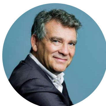
ARNAUD MONTEBOURG Ancien Ministre, Entrepreneur