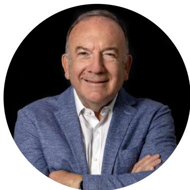
PIERRE GATTAZ Dirigeant de Radiall Ex Président MEDEF