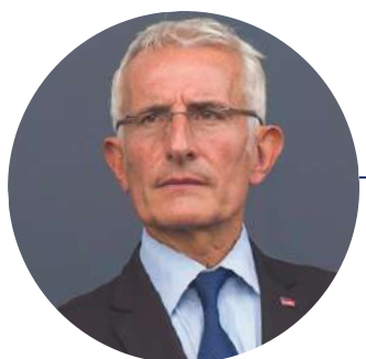
GUILLAUME PEPY Parrain de l'édition 2022