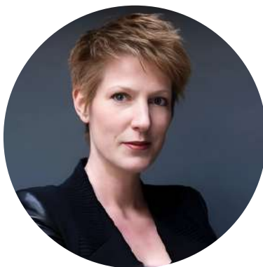
NATACHA POLONY Essayiste et journaliste