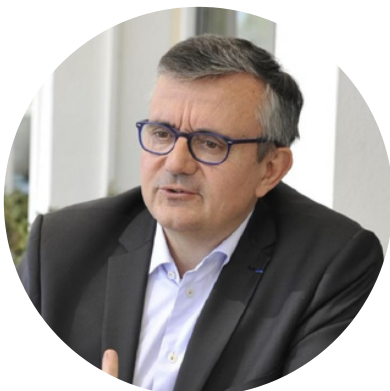
YVES JÉGO Ancien Ministre, Président d'honneur et Fondateur d'Origine France Garantie