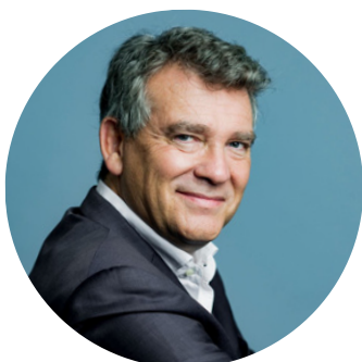
ARNAUD MONTEBOURG Parrain de l'édition 2024