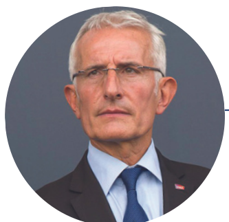
GUILLAUME PEPY Parrain de l'édition 2022