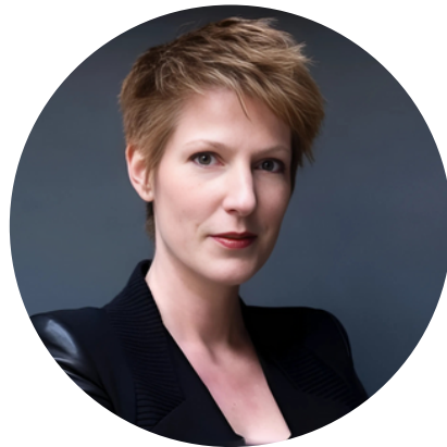
NATACHA POLONY Essayiste et journaliste