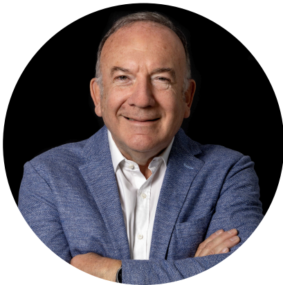
PIERRE GATTAZ Dirigeant de Radiall Ex Président MEDEF