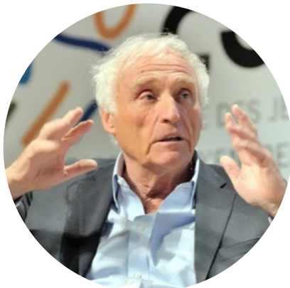
JEAN-MARC SYLVESTRE Economiste, producteur, éditorialiste...