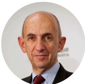
LOUIS GALLOIS Parrain de l'édition 2023