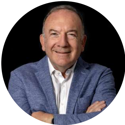
PIERRE GATTAZ Dirigeant de Radiall Ex Président MEDEF