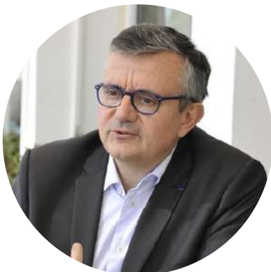
YVES JÉGO Ancien Ministre, Président d'honneur et Fondateur d'Origine France Garantie