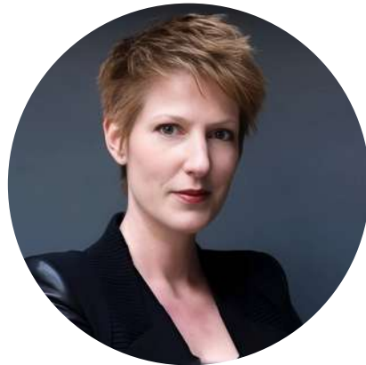
NATACHA POLONY Essayiste et journaliste